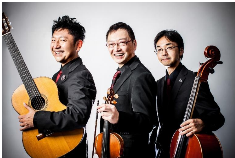
上垣内寿光 (クラシックギター)